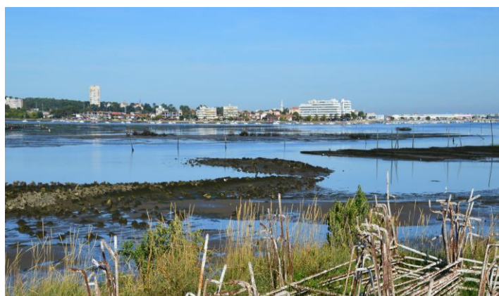
Vue d'ensemble du Port de Rocher