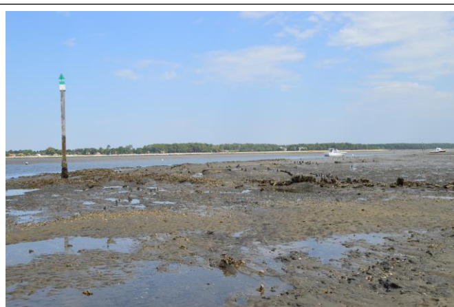
Décombres tuiles piquets parpaings C 7