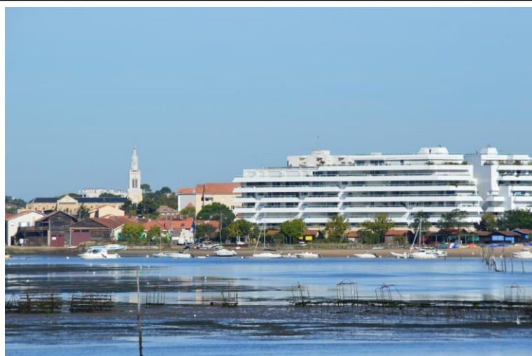
Aux abords de la Canelette de La Teste -ferrailles émergentes