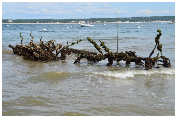
Mimbeau bord chenal