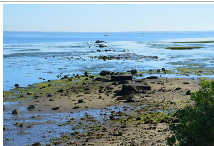
Décombres alignés d'une ancienne digue (?). Non repérés