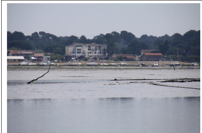
Chenal Lanton F3 rochers d'huîtres