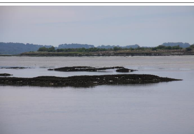
Pointe de Branne – rochers d'huîtres