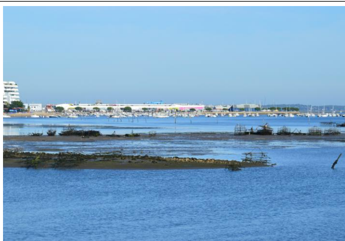
K1 port de Rocher -nombreuses ferrailles émergentes