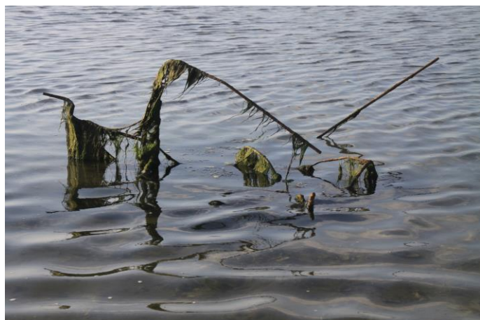
Sud île aux oiseaux -parcs en friches non balisés