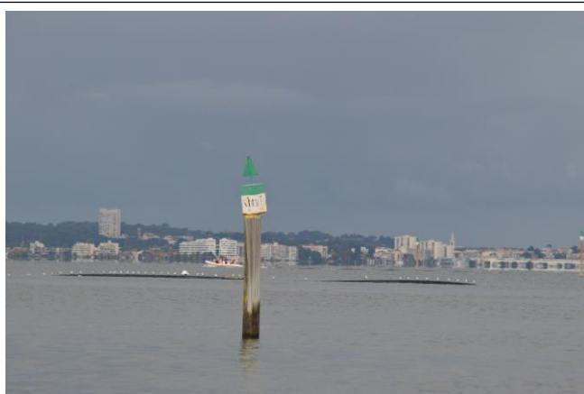
K11-Port du Canal. Canalisation non balisée