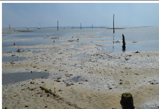
Alignement C6 vers C5a